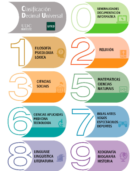
TABLA 4: sen asignación